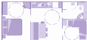
Plans et photos non contractuels