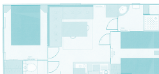
Plans et photos non contractuels