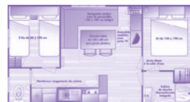
Plans et photos non contractuels