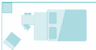
Plans et photos non contractuels

1 sleeping area with 1 double bed, duvet, pillows. Kitchen area with fridge top table, retractable table, 2 stools, dishes kit. Integrated semi-covered terrace. AGE : NEW