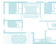
Plans et photos non contractuels

3 rooms : 2 double beds (140x190), 2 single bunk beds (80x190), blankets, pillows. Bathroom and separate wc. Kitchen area with fridge, microwave, dishes kit, gas cooking hob. Terrace. Age : 14 to 17 years.