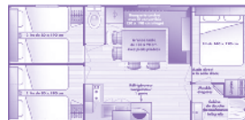
Plans et photos non contractuels