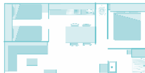
Plans et photos non contractuels